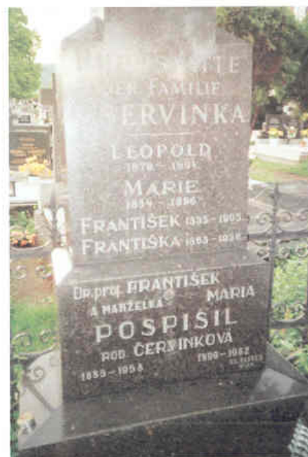
Místo posledního odpočinku