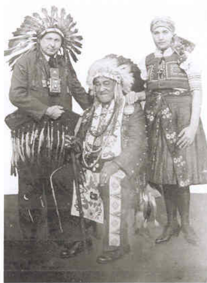
Pospíšilovi s indiánským náčelníkem