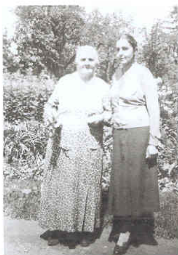
Šáry s maminkou