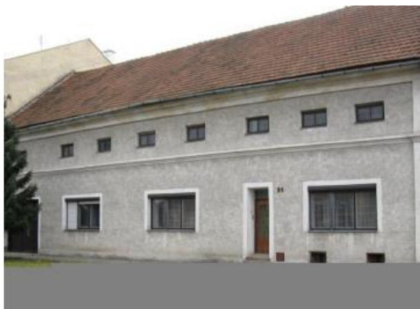
Obrázek 1 - Rodný dům - foto ze současnosti (již po několika rekonstrukcích)