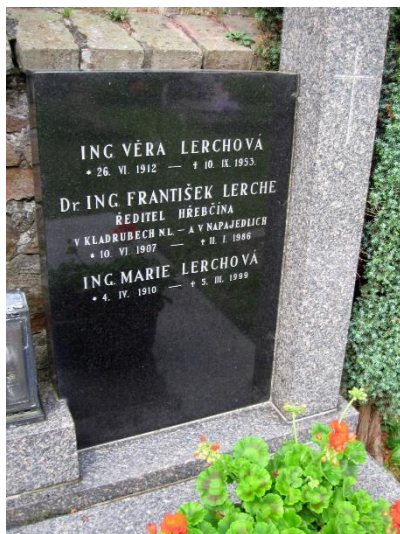
Obrázek 3 - hrob v Kladrubech nad Labem

Jeho obsáhlá publikační činnost představuje vydání několika desítek odborných knih i učebnic a stovky odborných článků.